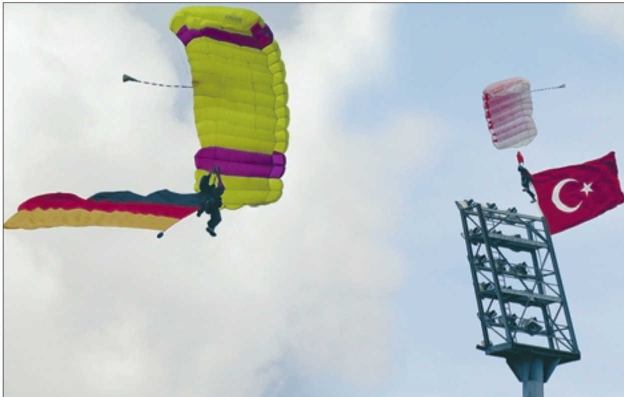
Ankunft des Islam im Westen: Voraussetzungen müssen erfüllt werden.

Religionsgemeinschaften, die ihren Mitgliedern das de jure oder de facto verweigern, sind ebenso erbärmlich wie ein Glaube, der sich gegen Kritik, selbst wenn sie in blasphemischer Weise vorgetragen wird, oft nur mit Larmoyanz, Aggressivität und Gewalt zur Wehr zu setzen weiß. Zugespitzt gesagt: Indikator für das Gelingen multireligiöser Gemeinwesen ist die Fähigkeit, auch Glaubenszweifel und Kritik souverän auszuhalten – und womöglich sogar Beleidigungen. Wer diese Souveränität nicht aufbringt (und das gilt natürlich auch für Christen), setzt sich dem Verdacht aus, nicht sonderlich glaubensfest zu sein. Das ist kein Freibrief für Blasphemie. Aber nicht das Strafrecht (Blasphemieparagraf) schützt die öffentliche Ordnung, sondern nur wechselseitiger Respekt und Toleranz.