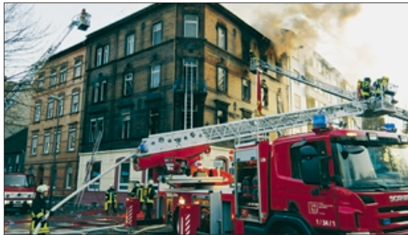
Brand in Ludwigshafen zeigt: Notfallseelsorge für Muslime ist notwendig.