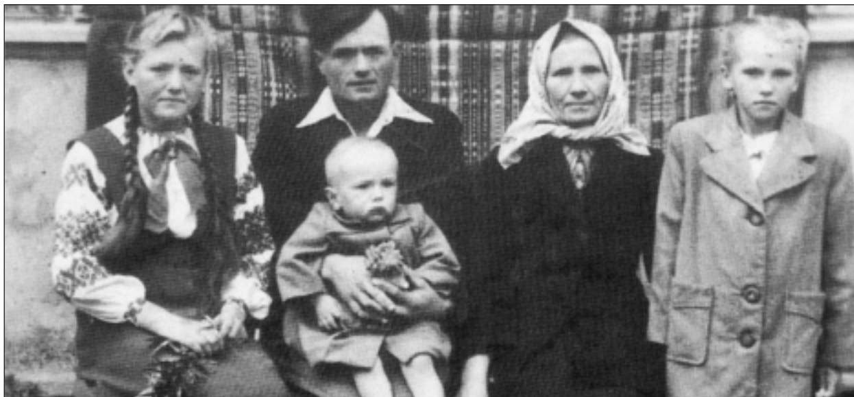
Vertriebene ukrainische Familie aus dem Dorf Honiatyn (Chelm) während der „Operation Weichsel“.

Zur operativen Einheit „Weichsel“ gehörten fünf Infanteriedivisionen, ein Pionierregiment, ein motorisiertes Regiment, ein Regiment mit Volkspolizei, ein Flugzeuggeschwader, eine Armeedivision des Korps für Innere Sicherheit mit 17 440 Soldaten und 500 Polizisten. Ziel war die Assimilierung der ukrainischen Bevölkerung. „Endgültige Lösung des Ukrainer-Problems in Polen“, waren die ersten Worte des Umsiedlungsprojekts. Vom Assimilierungscharakter der Aktion zeugen Programm und Art der Durchführung: Ansiedlung der Bevölkerung in verschiedenen, von einander entfernten Wohnorten, Zerschlagung nachbarschaftlicher und familiärer Gemeinschaft, Aussonderung der intellektuellen Elite und Inhaftierung in einem