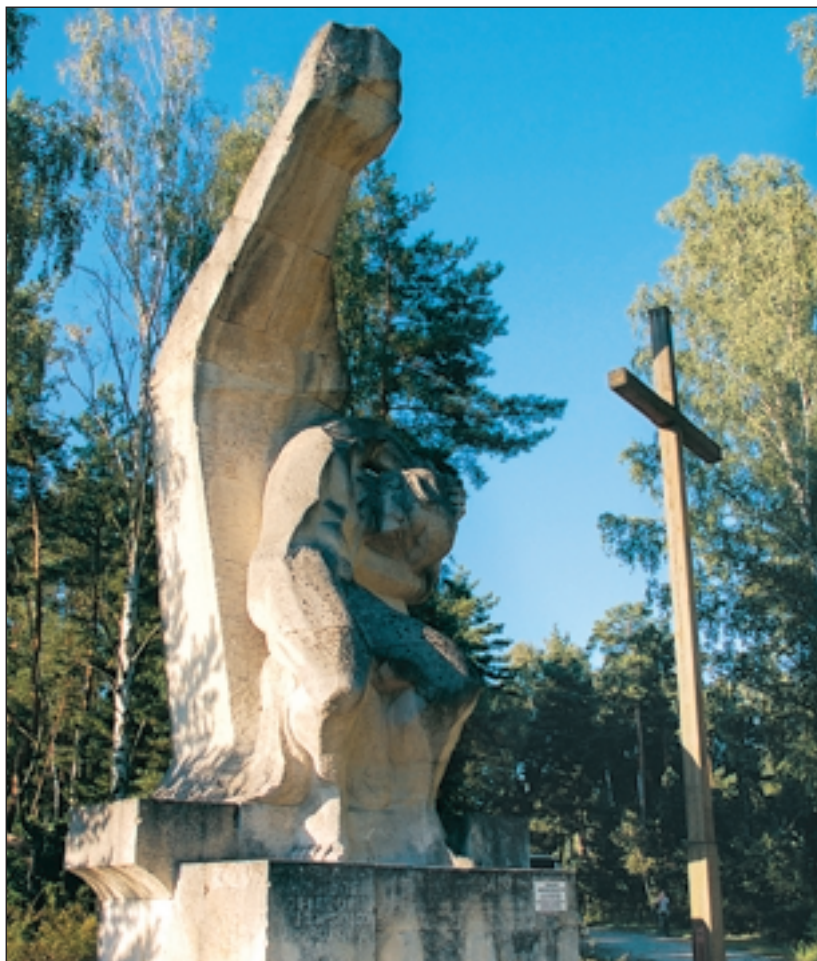
Erinnerungskultur in Polen: Mahnmal für deportierte Ukrainer.

In der jüdisch-christlichen Tradition wird der sorgfältige Umgang mit der Erinnerung kultiviert. Erinnerung ist ein biblisches Grundmotiv: Geschichtliche Erfahrungen müssen tradiert und von jeder Generation neu angeeignet und verarbeitet werden. Zu einer christlich geprägten Erinnerungskultur gehören Sensibilität für die Schwachen, Respekt vor den Opfern, das Bewusstsein eigener Fehlerbarkeit und Schuld, Versöhnungsbereitschaft sowie die Einsicht in die Begrenztheit der eigenen Perspektive. Wünschenswert ist eine europäische, nicht national verengte Erinnerungskultur. Den Kirchen könnte dabei tragende Bedeutung zukommen – vorausgesetzt die ökumenischen Bemühungen orientieren sich nicht primär an konfessionellen und ethnischen Grenzen und bleiben offen für den interreligiösen Dialog, vor allem mit dem Judentum. Christoph Picker